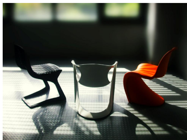
Bild 2: Freischwinger aus thermoplastischem Kunststoff: Myto (2007), Casalino (2007) Panton-Chair (1960)

Das Projekt gliedert sich in zwei Entwicklungslinien: In der makroskopischen Linie werden bionische Konstruktions- und Optimierungsprinzipien für die gleichzeitige Gestaltung der Makro- und Mesoebene eines Bauteils untersucht und mittels SLS und SMS am Beispiel des Freischwingers umgesetzt. Ergänzend werden Zielvorgaben für die Entwicklung mikrostrukturierbarer Materialien abgeleitet. In der mikroskopischen Linie wird das SLS und SMS so weiterentwickelt, dass Bauteile mit lokal veränderlichen oder gradierten Werkstoffeigenschaften erzeugt werden können. Dies erfordert eine simultane Entwicklung der pulverförmigen Ausgangsmaterialien und der Maschinenteknik. Es werden dazu zunächst zwei Konzepte untersucht: lokale Variation der Zusammensetzung und lokale Aktivierung der Polymerpartikel.